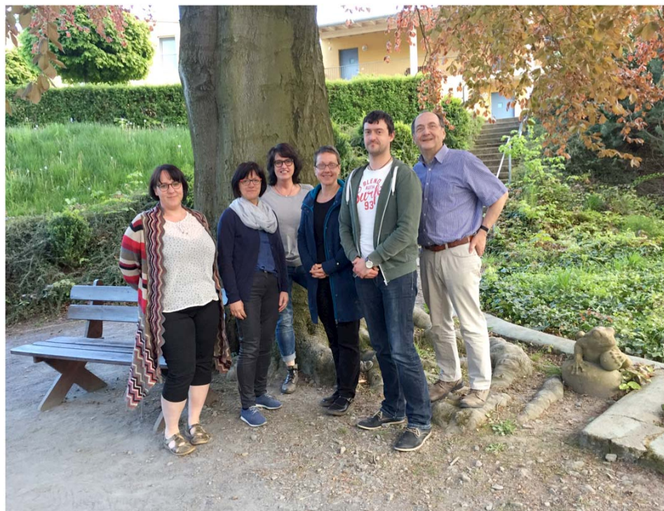
Abschlussbild in Naundorf bei Wehlen

Auch Inhalte, die mir zuvor fremd waren – wie z.B. gestaltungstherapeutische Elemente – lassen sich in der Praxis gut umsetzen und in die Arbeit integrieren. Insbesondere habe ich von der Eigenreflexion profitiert, mich auf der persönlichen Ebene weiterentwickelt. Dafür meinen herzlichen Dank!